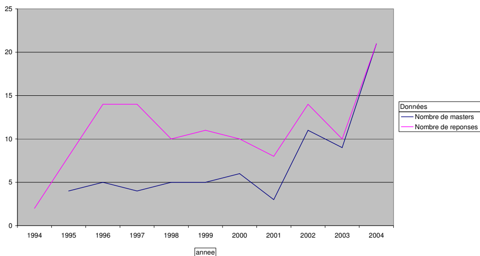
poursuites d'études après la maîtrise

Plus de la moitié des répondants ont poursuivi leurs études après l'IUP par un DESS / DEA ou Master 2, et à partir de 2002 les poursuites d'études niveau bac +5 sont devenues systématiques.