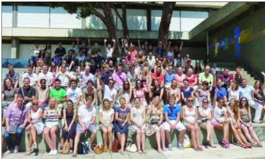
Accueillie chaque année sur le campus Carlone, l'université internationale d'été offre de grands moments de partage et d'échange entre étudiants de toutes nationalités. (JLB)

Aux premiers, l'UIE propose deux sessions de deux semaines chacune comportant des cours d'anglais intensifs concentrés uniquement sur les matinées. Ces cours sont ouverts à tous et s'adressent particulièrement à des niveaux B1 du cadre européen souhaitant se perfectionner vers le niveau B2. Les après-midi sont libres, mais les étudiants peuvent se joindre aux sorties culturelles de l'UIE. Le second public est composé d'étudiants étrangers qui recherchent des cours de français lan-