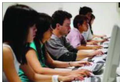
Cours magistraux ou TD, les étudiants s'habitueront au type de cours qui les attendent.

Pendant tout le mois d'août, ces étudiants suivront un cursus qui leur permettra de mieux vivre leur expérience à l'université et donc d'obtenir de meilleurs résultats. Les enseignements sont principalement de trois types : des cours intensifs de FLE pour être capable de suivre les enseignements universitaires en français ; une introduction aux méthodologies françaises (dissertation, commentaires, etc.) et au fonctionnement du système universitaire et enfin des cours de civilisation et culture françaises indispensables pour saisir le contexte culturel dans lequel ils vont évoluer pendant leurs études. Une partie de ces enseignements sera donnée en tronc commun et une autre suivant une spécialité choisie par les étudiants en fonction de leur forma-